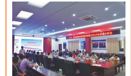
项目5月份质量分析会

一、质量安全红线管理文件制定情况 项目部质量安全红线管理工作严格按照铁总与东南公司相关文件要求开展,近期根据铁总、南昌质监站、东南公司、厦门指挥部相关意见对《质量安全红线管理实施细则》进行修编,现已修编完成并重新发布。 二、质量安全红线管理工作情况 目前项目部质量安全红线管理形成以“检查计划—检查通知—检查通报—整改闭合—统一记录分析—形成会议纪要”为主线的工作流程。 2018年4月至5月,项目共开展四次质量安全红线检查活动,依据“五定”原则对泉州湾跨海大桥各桩基、承台施工点与灵溪特大桥桩基施工点,钢筋加工厂,拌和站进行了检查,其中由质量安全红线管理领导小组统一部署检查重点,针对原材料、泥浆指标与成孔质量、钢筋笼质量及混凝土性能等进行重点检测;并组织召开月度质量分析会,对检查问题统一分析,制定整改及预控措施,从源头降低问题出现概率,排查质量隐患,提升质量管理水平。 三、后续工作要求 在后续施工中,项目部将严格进行源头预控,针对质量安全红线检查发现的问题追根溯源,狠抓整改,加强诊断分析,排除隐患;强化过程检查和日常管理,从发现问题、整改问题变为预防问题,建立健全全过程检查机制和“五定”工作机制,以规章制度和经济手段强化质量安全红线管理力度,确保工作不走过场、不留死角,取得实效,建设过程达标、安全可靠、质量一流的精品工程。