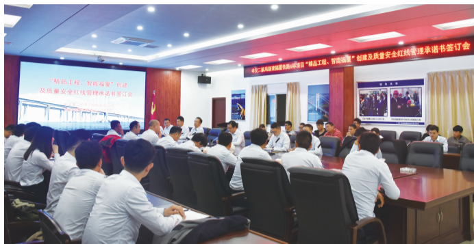
“精品工程、智能福厦”创建及质量安全红线管理承诺书签订会