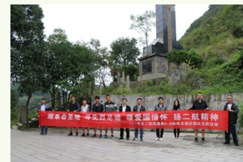
在祖国66周年华诞之际,乌江大桥项目党支部组织参观遵义会址、瞻仰红军山烈士陵园,接受了一次革命传统教育。