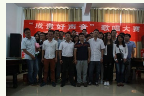
为庆祝祖国66周岁华诞,成贵项目部以“健康、和谐、团结”为主题精心组织了一系列“迎十一、庆国庆”文体活动。欢歌笑语与不断推进的一线建设,在国庆期间交织出成贵好声音。