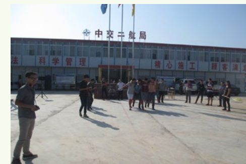
10月2日,为庆祝祖国六十六周岁诞辰,中交二航局五公司新干航电枢纽W3标项目部举行“舞动青春,圆梦赣江”国庆趣味运动会。