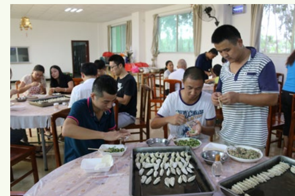
10月1日下午,中交二航局五公司深茂铁路项目组织员工在食堂开展包饺子活动。