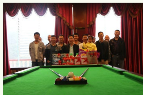
乌江大桥项目党支部在“十一”期间举行了主题为“激情‘碰撞’、欢度国庆”的台球比赛活动。