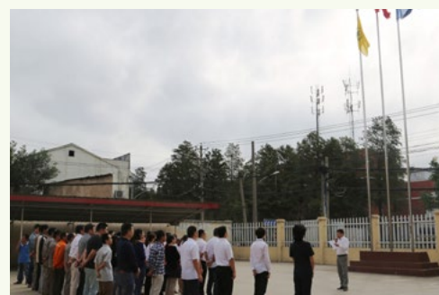
国庆即将到来,分公司物流中心党支部于9月30日上午9点在办公楼前举行了升旗仪式,以升国旗的形式来庆祝我们伟大祖国66周年华诞。