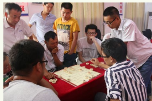
10月1日早上,深茂铁路标工程指挥部“庆国庆、构和谐”职工系列趣味活动正式拉开帷幕。