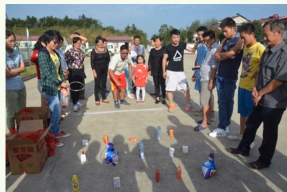
10月1日下午,为庆祝中秋、国庆双节,丰富员工文化生活,营造积极向上、敢于拼搏、团结协作的项目文化氛围,武深高速TJ-4标项目部党政工团齐携手,秉承“让文化升级,让激情飞扬”的理念,组织开展了气氛热烈、轻松愉悦的系列文体活动。